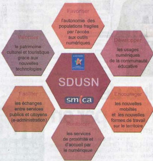
• Stratégie de Développement des Usages et Services numériques

Afin de mettre en place cette démarche, le département de l'Aveyron s'est adressé et associé au SMICA pour définir ensemble une méthodologie. Le projet consiste donc dans la réalisation d'une stratégie de développement des Usages et Services Numériques (SDUSN). "Le débit et la fibre sont des questions essentielles pour les gens qui ont le désir de s'établir dans le département de l'Aveyron. Si on ne leur donne pas ce dont ils ont besoin, on risque de freiner leurs envies mais aussi de perdre de la population et même des entreprises", insiste le directeur du SMICA. Le 25 mars 2016, l'assemblée départementale a adopté le projet de mandature du Conseil départemental jusqu'en 2016-2020 sous le nom de Cap 300 000,